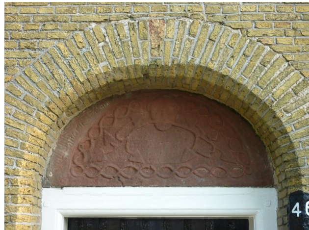
In de noordmuur zijn de boogvormige romaanse vensters nog zichtbaar, rechts de 'Groene man'.